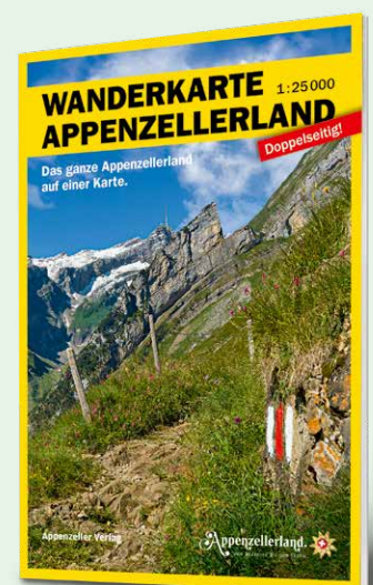
Wanderkarte Appenzellerland Massstab 1:25 000 beidseitig bedruckt, Fr. 38.– ISBN 978-3-85882-821-7 Appenzeller Verlag