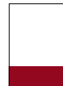
1/4 188 × 65 mm 4-farbig Fr. 660.-