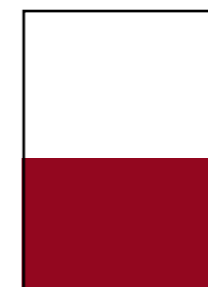
1/2 188 × 134 mm 4-farbig Fr. 1295.-