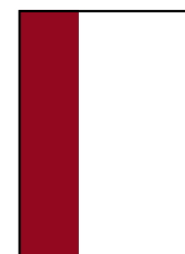
Editorial 1/3 60 × 272 mm 4-farbig Fr. 860.-