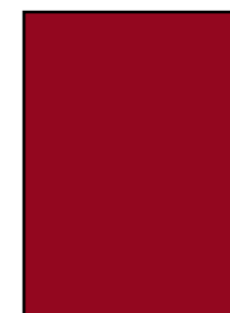
1/1 188 × 272 mm 4-farbig Fr. 2520.-