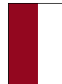
1/2 92 × 272 mm 4-farbig Fr. 1295.-